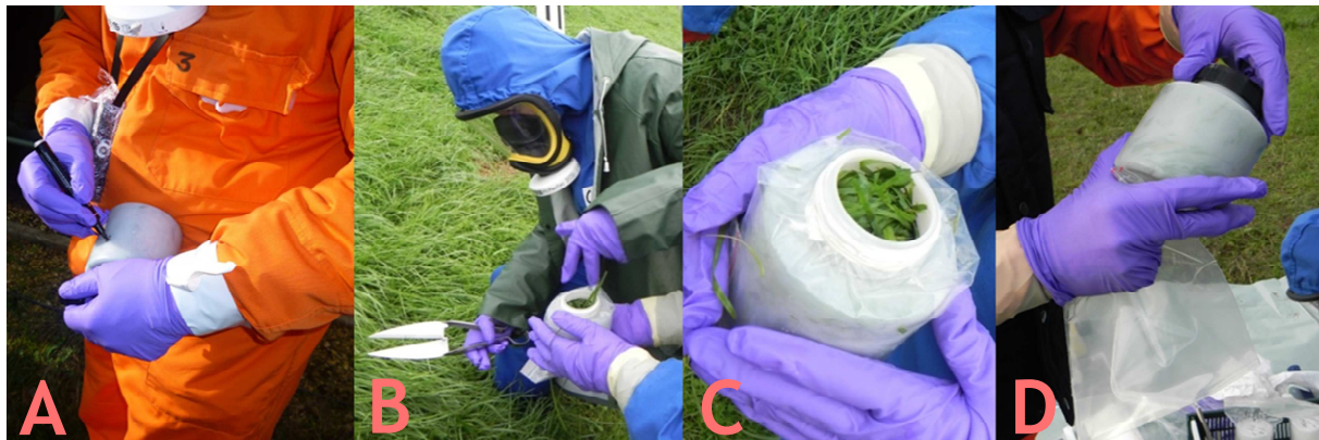
Identification du prélèvement