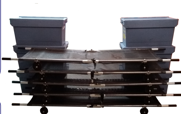
Échantillons pour illustration

Extraire et réaliser la décontamination d'urgence de victimes d'attentat RBC