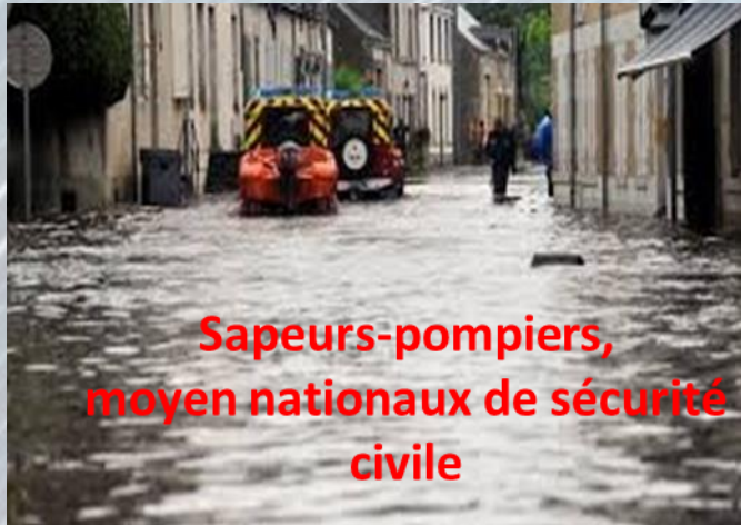
Sapeurs-pompiers, moyen nationaux de sécurité civile