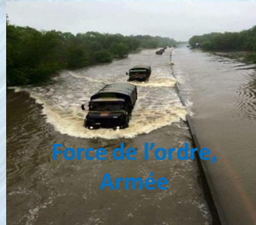
Force de l'ordre, Armée