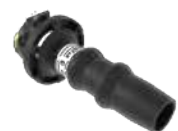
Adaptateur mousse BF ou MF