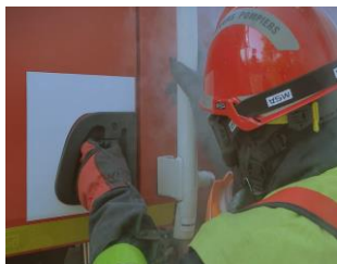
6 - En fonction de l'exposition du CCF, le personnel pénètre coté opposé au flux thermique.

Les personnels longent le CCF en se servant du balisage extérieur pour regagner la cabine. (bandes jaunes et poignets blanches)