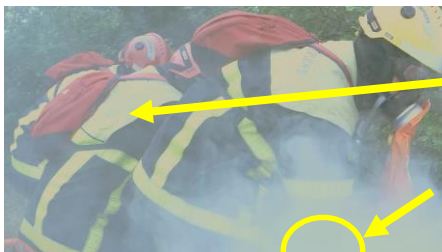
4 - Le chef d'agrès organise le repli

En respirant de l'air moins vicié, les chances de retour en cabine sont améliorées.