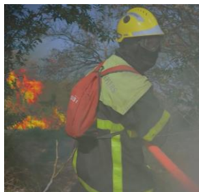
1 - Le chef d'agrès donne l'ordre de repli.

Permettre aux personnels d'arriver au CCFM pour se mettre en sécurité dans la cabine.