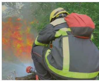
2 - Les personnels s'accroupissent. La lance reste ouverte en JD protection