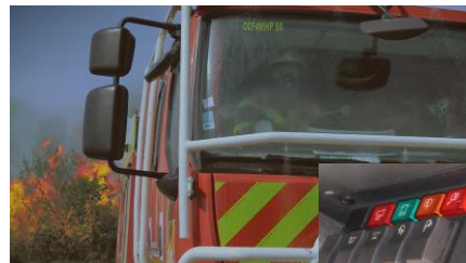
8 - Le conducteur actionne l'avertisseur sonore.