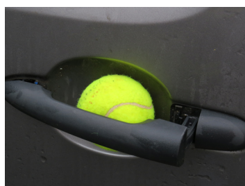
Balle de maintien

Pour maintenir les portes ouvertes, une balle de maintien peut être utilisée