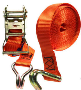
Sangle à cliquet