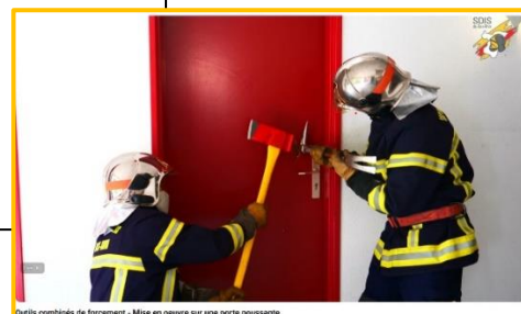
Outils combinés de forçement - Mise en oeuvre sur une porte poussante

https://enasis.fr/mod/scorm/view.php?id=57790